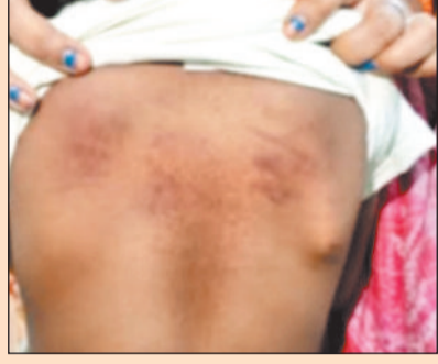
सुनते ही सहम जाता है। हम अपने बच्चों को शिक्षा के लिए स्कूल भेजते हैं, ना कि प्रताड़ना और डर के लिए। बिना किसी गलती के इतने छोटे बच्चे को मारना अमानवीय और अस्वीकार्य है। हम चाहते हैं

परिजनों ने बताया कि सोमवार दोपहर करीब 12 बजे जब वे स्कूल से बच्चों को घर लेकर लौटे और कपड़े बदलवा, तब उन्हें छोटे बेटे की पीठ पर गंभीर चोटों के निशान दिखाई दिए। इस पर जब पूछताछ की गई तो बच्चे ने बताया कि उसे स्कूल में टीचर ने मारा है। परिजनों के अनुसार, नर्सरी में पढ़ने वाले बच्चे को कोई गलती नहीं थी। वह केवल स्कूल आकाश सेट भड़क गया और बिना किसी चेतावनी के उसे पीटना शुरू कर दिया। घटना से आहत परिजनों का कहना है कि उनका बच्चा अब मानसिक रूप से उदा हुआ है और स्कूल का नाम